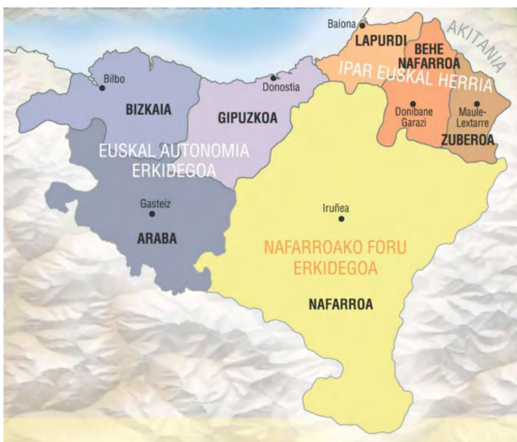
Mapa n.º 1. Territorios vascos situados a ambos lados de la frontera

Este artículo realiza un análisis comparativo de los niveles de institucionalización y gobernanza 1 en los territorios vascos situados a ambos lados de la frontera, sabiendo que estos territorios están divididos en dos Estados (Francia y España) y tres realidades político-administrativas (la Comunidad Autónoma del País Vasco o CAPV y la Comunidad Foral de Navarra o CFN en la península ibérica y la Comunidad de Aglomeración del País Vasco en el territorio vecino) (Urteaga, 2017a).